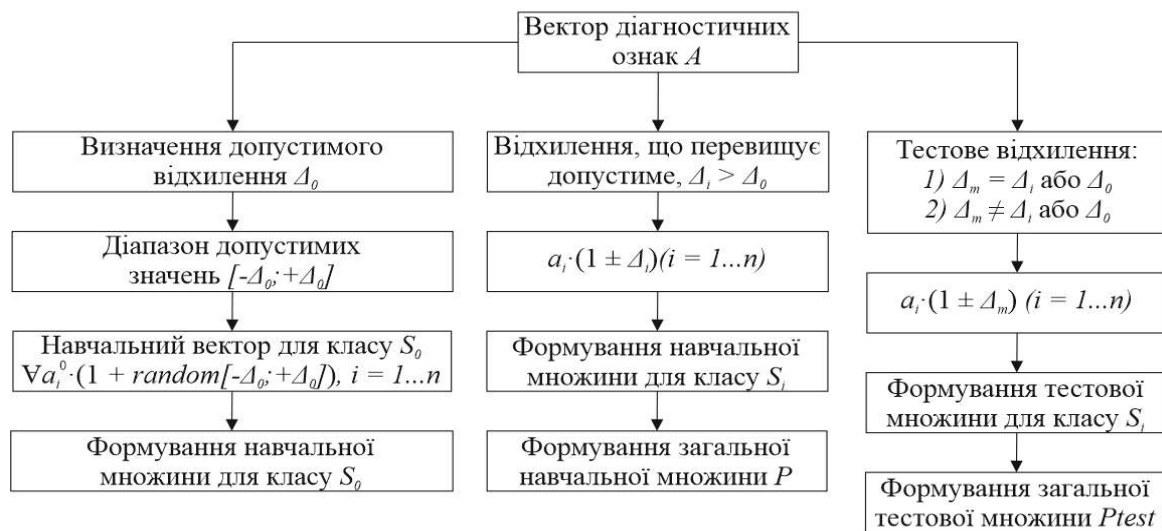
Рис. 1. Інформаційна модель процесу формування навчальної та тестової множин вхідних векторів діагностичних ознак для багатокласового розпізнавання з метою локалізації одиничного пошкодження

Для множини навчальних векторів кожного стану були обрані та задані такі граничні відхилення значень діагностичних ознак \pm \Delta_i для навчання: \pm 5,5\% ; \pm 10\% ; \pm 15\% ; \pm 20\% ; \pm 25\% ; \pm 50\% .