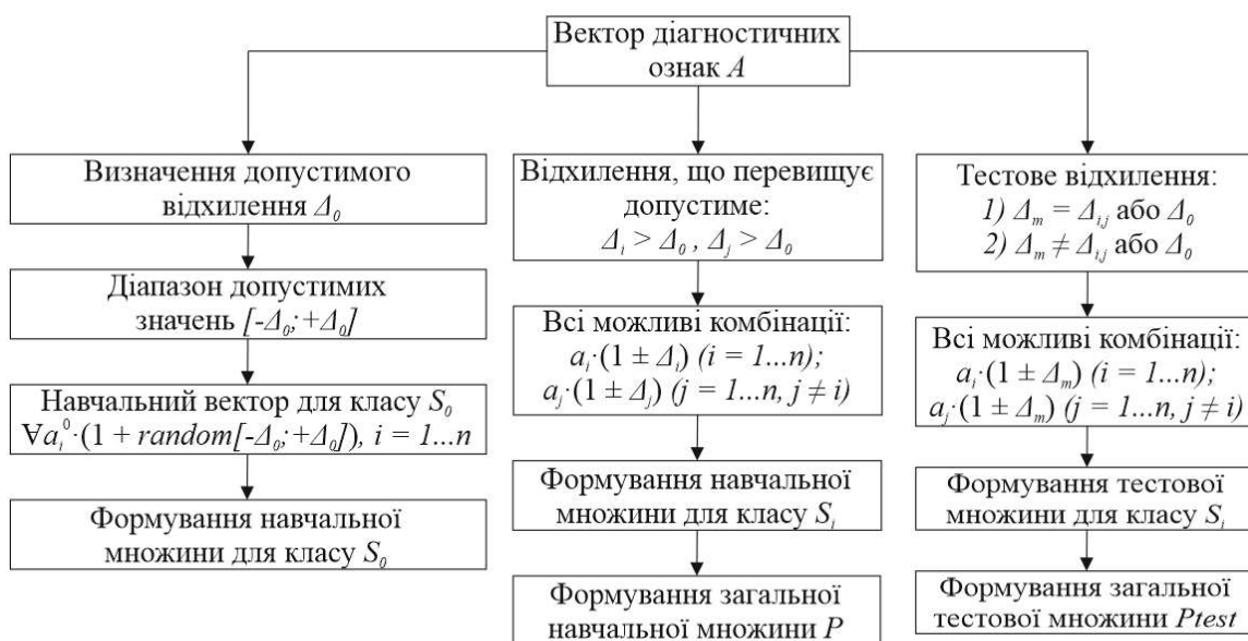
Рис. 2. Інформаційна модель процесу формування навчальної та тестової множин вхідних векторів діагностичних ознак для багатокласового розпізнавання з метою локалізації двох пошкоджень

Для множини навчальних векторів кожного стану були обрані та задані такі граничні відхилення значень діагностичних ознак \pm \Delta_i , як і для локалізації одиничного пошкодження.