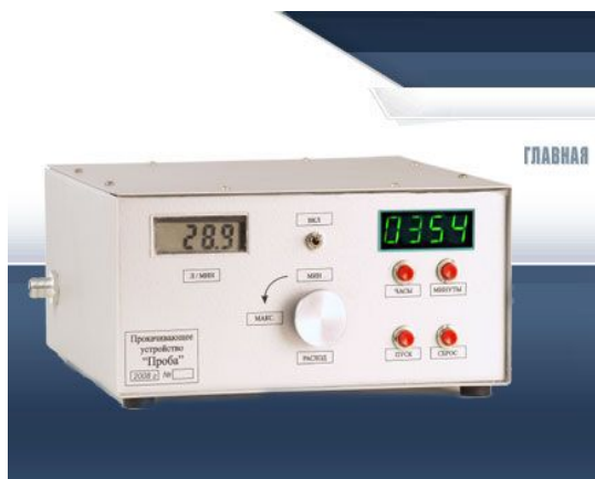
Рис. 1. Вітчизняний пристрій для відбору проб пилу «ПРОБА»

швидкі динамічні змінні газового потоку гравіметричним методом вимірювати практично неможливо.