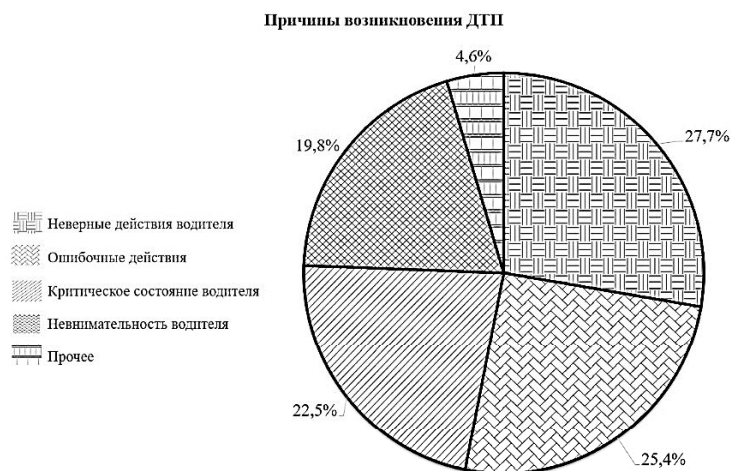
Рис. 1. Диаграмма причин возникновения ДТП [1]

Данная тема является актуальной, поскольку более 40% ДТП происходит из-за невнимательности водителя (рис. 1), а электронные ассистенты сводят этот процент к минимуму [2].