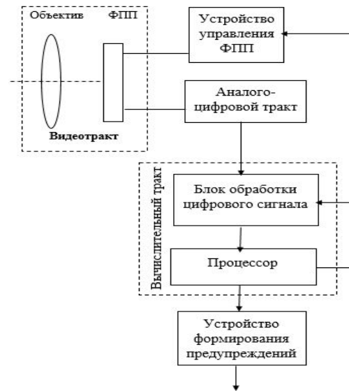
Рис. 4. Функциональная схема детектора дорожной разметки