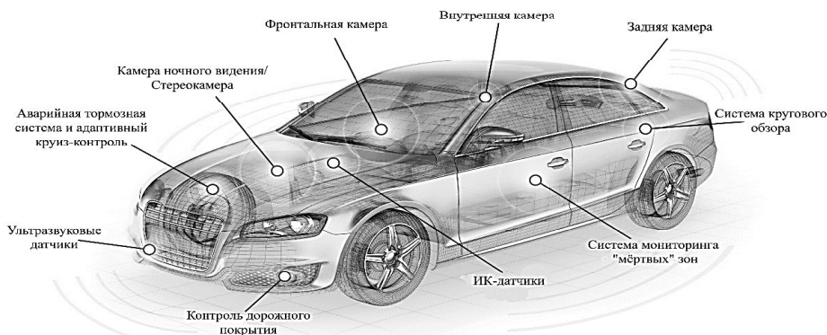
Рис. 3. Схематичное представление автомобиля с ADAS