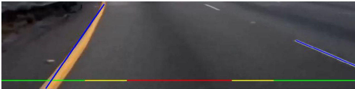
Рис. 6. Пример работы алгоритма нахождения дорожной разметки